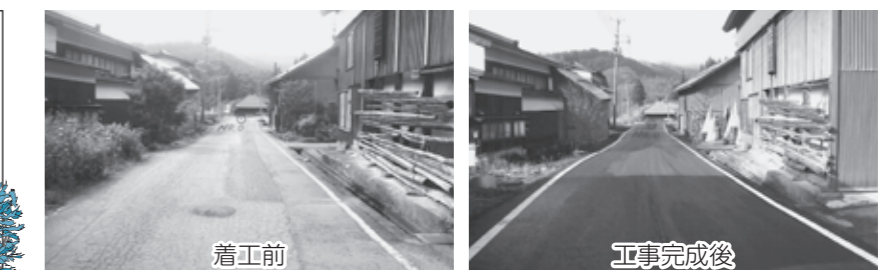
緊急経済対策で舗装のオーバーレイ工事が行われた町道蒲沢線

都市計画事業である下水道整備に要した、町の借金返済分の一部として使わせていただきました。 【H21：985万円】