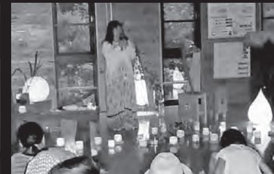
オカリナコンサート