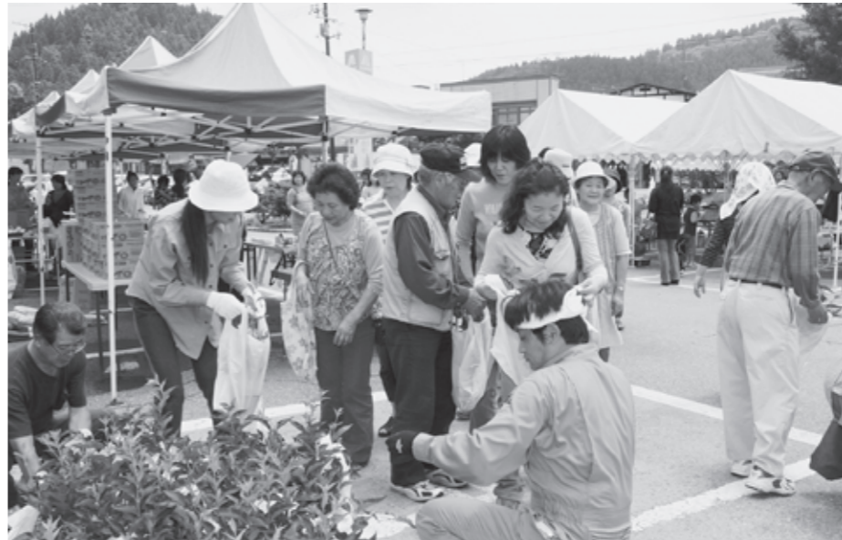
金山の夏の風物詩にもなっている金山町商工会主催の「自然祭・グリーン市」は、会員の息の合った連携プレーでサービス満点！