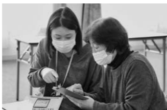
4年度に実施したマホ教室。誰もがデジタルを活用できる町を目指す

町民の利便性向上と業務の効率化を柱に、デジタル化を推進していきます。エンターテインメント事業者をアドバイザーに迎え、「楽しさ」をキーワードに新たな行政サービスの提供を目指します。5年度はデジタル化推進計画を策定します。