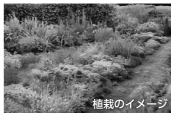
著名なガーデナーの協力のもと多年草をメインに植栽予定

花をきっかけとした新たな景観事業として、「手間をかけない自然に近い美しさ」を意識した植栽事業を展開します。テーマは「町をひとつの庭に。花でつながる風景と人」。公園や各家庭に豊かな風景を広げる構想です。