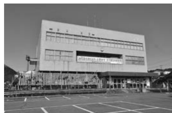
解体を予定している旧中央公民館

令和7年度の高規格道路の開通に向けて、旧中央公民館跡地を含めた一帯に、中央公園(仮称)を整備します。令和5年度は、旧中央公民館や防災倉庫等、敷地内の施設を解体し、駐車場として活用できるよう舗装工事を行います。