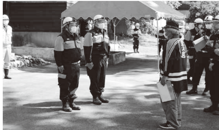
西郷地域防災訓練の様子

危機管理業務は人手と経験が非常に重要と考えるため、知識と経験を有する職員のスキルアップを行う