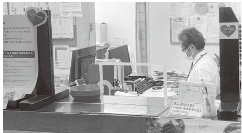
出納室窓口の業務風景

において使用する庄内銀行と連携しているシステムである。公金収納のためのシステム活用として積極的に活用し、職員が出向く必要がないよう導入する。業務費手数料に計上している。