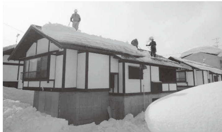
羽場の戸建て住宅の雪下ろし作業

現段階での基準は定めていないが、事前に巡回指導を行う。一般的な修繕の負担区分は決めているため、