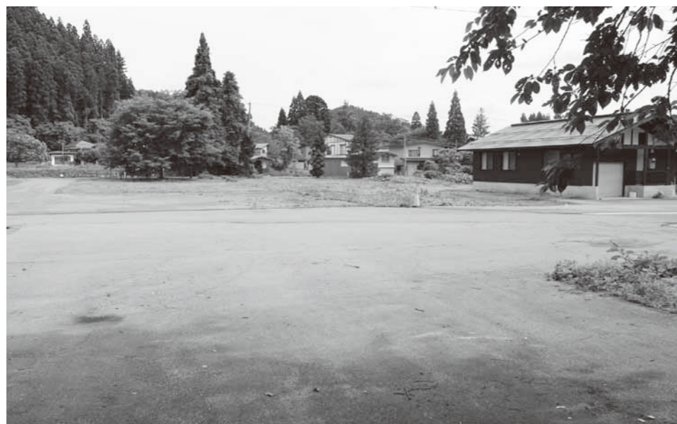
町有地である旧金山木材跡地