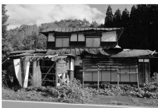
平成30年度に行政代執行を行った危険空き家

環境整備課長 空き家対策について定めた特別措置法の趣旨は、「適切な管理が行われていない空き家等が防災、衛生、景観等の地域住民の生活環境に深刻な影響を及ぼしていること」に鑑み制定されたもの。「金山町修景形成助成金交付要綱」も、町民の安全と安心、景観の保持の観点から管理不全な状態の空き家等を除去するため、施行したものであるが、「金山町空き家等対策協議会」において、本事業の経緯や町内の空き家解体の実態と今後の状況を勘案し、修景形成助成制度の在り方について意見をいただきたいと考えている。