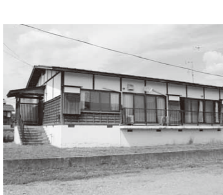
現在は活用されていない旧医師住宅

考えている。また、支給方法を来年度に向けて、直接口座振込なども含めて条例見直しを来年度3月まで検討していく。