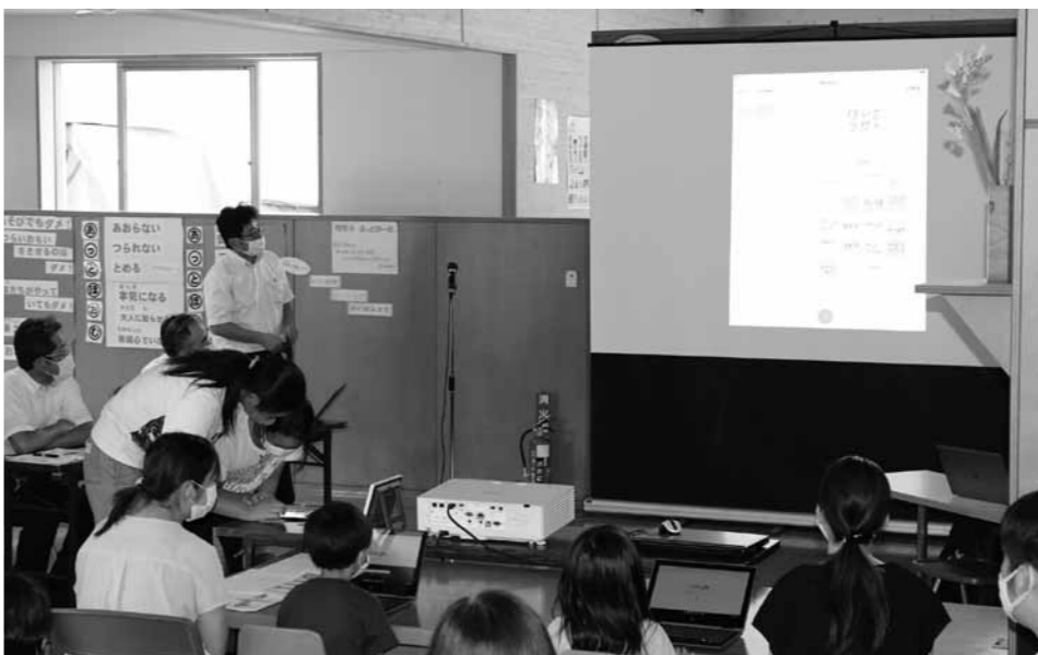
5月よりタブレット導入した授業風景（明安小）