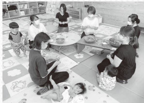
シトラスリボンを作成する「MaMa'sサークルおひさま」の様子

子育て支援センター内で活動している「MaMa'sサークルおひさま」では、シトラスリボンプロジェクトにいち早く賛同し、子育てをする傍ら、シトラスリボンの作成に取り組んでいる。