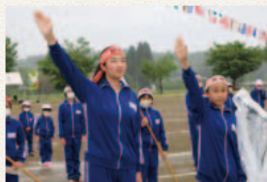
明安小学校閉校記念大運動会 (5/23)

統合後においても、これまでどおり地域の皆さんには子供たちを見守っていただき、育ていただければと思っております。