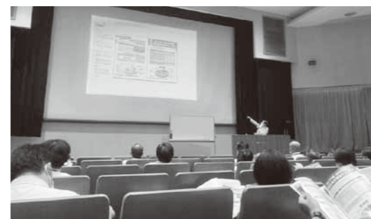
議会広報クリニックの様子

これからの広報は住民の目を引き付ける誌面づくりが重要であり、例えば、写真と見出しを見れば何が書かれているかわかるような見やすい手法を心掛けていきたいものである。