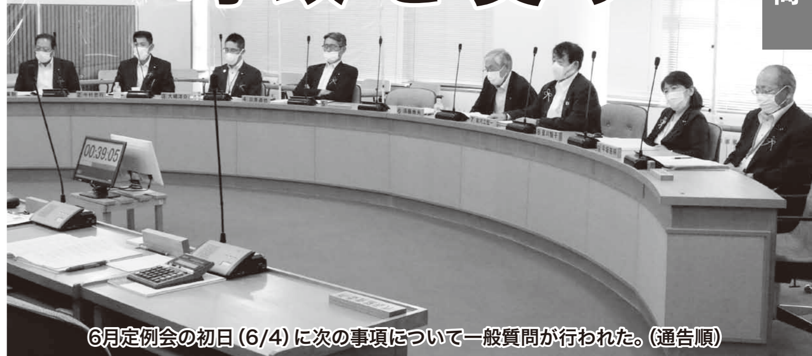
6月定例会の初日(6/4)に次の事項について一般質問が行われた。(通告順)