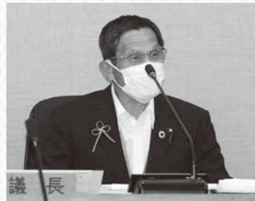
議員もリボン を付けて審議

この度、愛媛県の有志グループ（ちょびっと19+）が発端となって、新型コロナウイルス感染症に関する誹謗中傷を無くするための取り組みとして全国的に広まりつつある「シトラスリボンプロジェクト」の考え方に金山町議会として賛同し、6月定例会において取り組んだ。