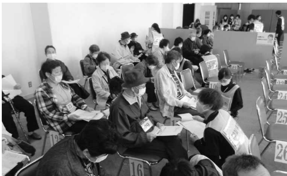
新型コロナウイルスワクチン接種会場の様子

6月定例会が6/4～6/8の5日間行われ、一般会計補正予算など8議案を全員賛成で可決した。一般会計では、新型コロナウイルスワクチン接種体制整備分に係る管理職の手当てや低所得子育て世帯支援給付金支給、また、5月3日と5月25日の降電発生でのニラなどへの被害への支援策(県と連携)などが可決された。今年度予算総額は、38億8080万円となった。