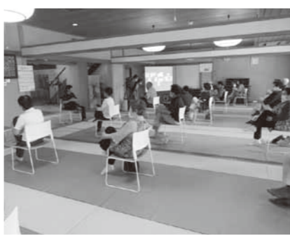
デジタル機器を活用した介護予防事業風景

答 食用米の生産面積は、昨年より町では約10町歩ほど増えている。仮に今から生産調整の対応をしていただくとした場合、既に作付けは終わっているが、主食用米を飼料用米へ転換するという事もある。