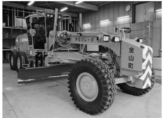
今年、老朽化していた除雪ブレードを買い替え。旧機よりもブレード幅が約1m広くなり、効率性・機動性が向上。