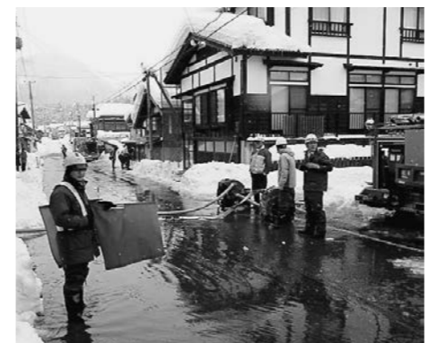
ポンプを利用した排水処理 (平成28年1月20日：町道十日町羽場線)

快適に雪処理するにはマナーが大切！ 大雪の日は： 水路への投入は手作業で必要最小限に。水上がりしたら： 地域ぐるみで水上がりを理解し、相互の協力で解決しましょう。水上がりの知らせがあった時は、水路への投入は絶対にやめてください。