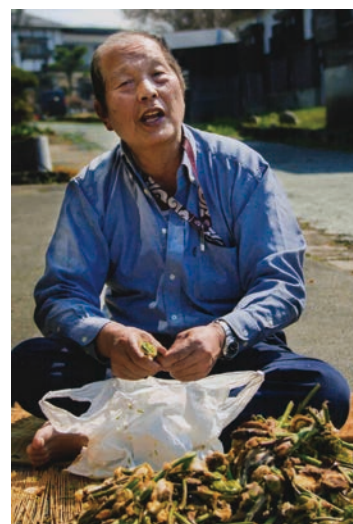
■金山のおとつあん