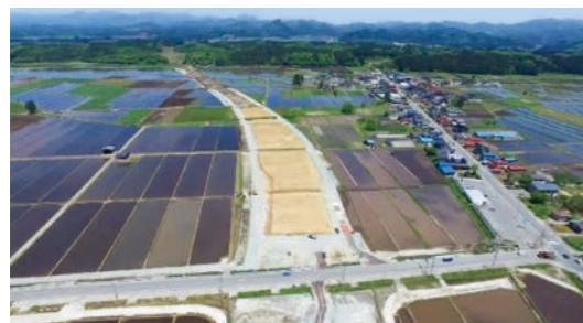
▲新庄金山道路 撮影方向：(仮)昭和ICから金山町方面を望む

▲出典：東北地方整備局山形河川国道事務所ホームページ http://www.thr.mlit.go.jp/yamagata/road/roadmap/#03