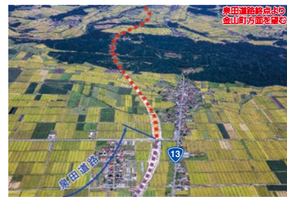
事業区間周辺(航空写真)