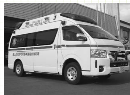
消防本部・消防署では、消防ポンプ自動車や水槽付消防車、先端屈折式はしご付消防自動車などの消防車両のほか、高規格救急車を配備。迅速な出動を可能にしています。