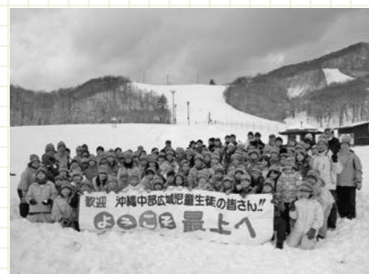
今年度32年目を迎えた青少年沖縄派遣交流事業では、沖縄中部広域圏の児童らとの相互で交流。当町においては、グリーンバレー神室でスキー体験が恒例となっています。