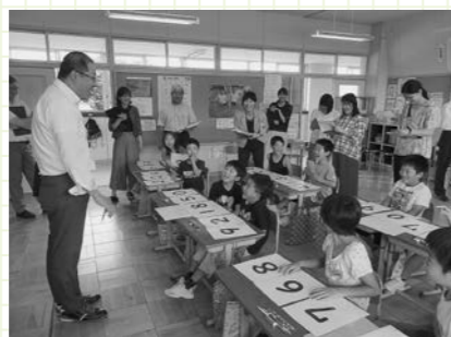
学校教育の質向上のため、教育研究センター算数・数学スーパーバイザー（指導主幹）配置事業を実施。管内の小・中学校の教職員を対象に学校訪問指導授業を行っています。