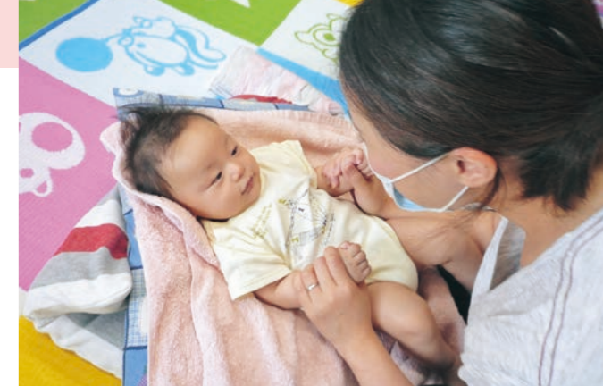
◎プレベビーマッサージの様子

切れ目のない支援を よりよい親子・家族関係を築くためには、働き方改革と同時に子育て世代を地域で親身に支える仕組みが重要です。子育ての日々は、子どもだけでなく、親自身も成長する喜びの貴重な時間です。金山町子育て世代包括支援センターでは、妊娠期から子育て期のお母さんやご家族の不安や悩みなど様々な相談に応じ、安