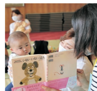
◎ブックスタートの様子

かかわま子育て支援宣言 かけがえのない「いのち」を産み育てていくことは尊いものであり、地域の宝である子どもの健やかな成長は町民の願いです。平成29年3月に「かかわま子育て応援宣言」を掲げ、金山で生まれ、成長する子どもたちのため、育児をする家族のために様々な支援・助成を行っています。