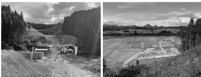
新庄金山道路(上台地区内)の工事状況