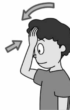
▲嚥下おでこ体操のイメージ