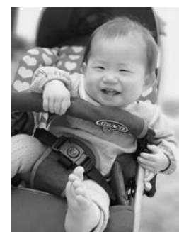
ほとせ 長沼 北斗星ちゃん