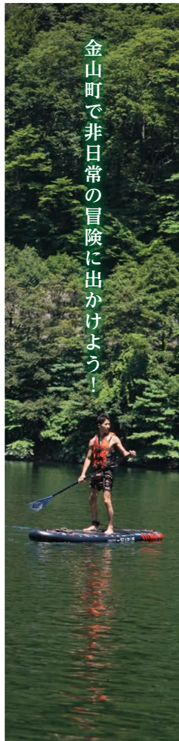
金山町で非日常の冒険に出かけよう!

大自然の中で楽しめるアクティビティスポーツ SUP (サップ) が8月11日 (金) から神室ダムで体験できるようになりました! 神秘的な雰囲気のあるダム湖では、ここが日本であることを忘れてしまうほどの迫力です。貸切りクルージングとなっており、ペットや小さいお子様のいる世帯でも快適にツアーを体験することが出来ます。また、浮力の強いサップの上は安定しており、子どもや未経験者でも手軽に楽しむことが出来ます。