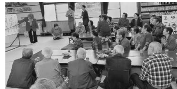
▲ボケない小唄を合唱し、盛り上がる皆さん

10月15日、羽場地区公民館で「第19回 長寿を祝う会」が4年ぶりに開催されました。羽場地区在住の78歳以上57名中、26名が出席しました。踊りやスコップ三味線などのアトラクションが披露され、羽場婦人会考案の「ボケない小唄」と「北国の春」を全員で合唱、芋の子汁とお弁当を食べて楽しい時間を過ごしました。