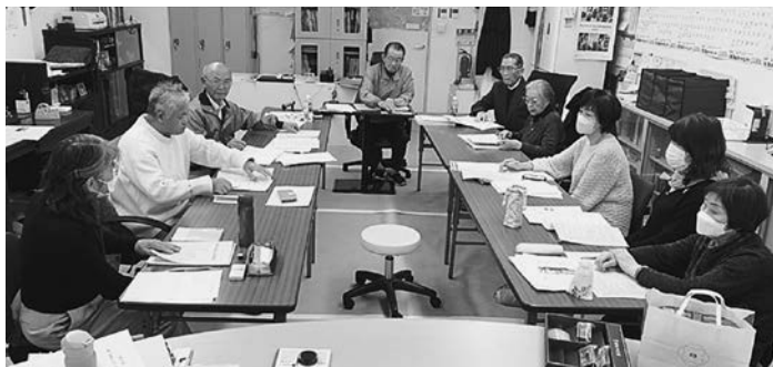
▲役員会の様子(東京金山会事務所)

本役員会当日は「かねやま市」の2023年最終の開催日、役員会メンバーが一同に会して運営を行ないました。2024年の「かねやま市」も、さらに多くの方に来訪いただき、一層盛り上げていければと思います。