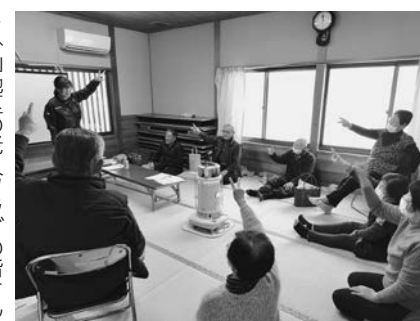
▶ 朴山地区の老人クラブの皆さん

みなさんこんにちは。寒い日が続きますが体調はいかがでしょう。金山町に着任してから10ヶ月が経ちました。いろんな教室で運動を通してたくさんの方々とお話することができました。ありがとうございます。今回は11、12月の活動をご報告します。11月、山崎地区と柳原地区からモルック指導の依頼を受けて、みなさんと一緒に大会に向けたゲームを楽しみました。初心者の方にも分かりやすく解説を行いながら、ベテランさんからのサポートもいただきモルックの面白さや楽しさを体験いただきました。12月、健康福祉課の健康相談会に同行し田茂沢地区と朴山地区のお声を聞いてきました。お家でもできる運動や脳トレ体操を行いながら集落の課題を探るためのアンケート調査にもご協力いただきました。またイベント教室では11月にエアロビクス、12月にはヨガを行いました。有酸素運動でいい汗を流し、ヨガは筋トレがメインのコンディショニングトレーニングとなりました。今後も運動教室を続けて欲しいとの嬉しいお言葉もいただきました。これから検討したいと思います。