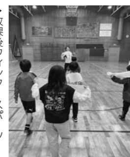
▶放課後ウィンタースポーツスクールの様子