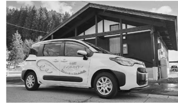
▲利用者が見つかりやすいように、側面のデザインも新しくなりました！

3月13日、金山町デマンドハイヤーの車両が1台納車されました。今までの車両より室内が広く、利用される方を快適に目的地までご案内することができます。また、年内には車いすのまま搭乗が可能な福祉車両のデマンドハイヤーも運行を開始する予定です。デマンドハイヤーは平日の9時台から13時台まで、町内どこでも運行ができますので、町民の皆さんのご利用をお待ちしております。(利用する前日の15時まで予約をお願いします。)