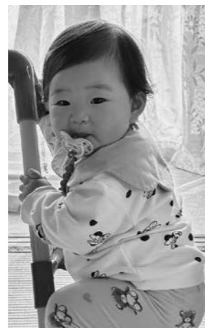
たかはし なぎ 高橋 凧くん