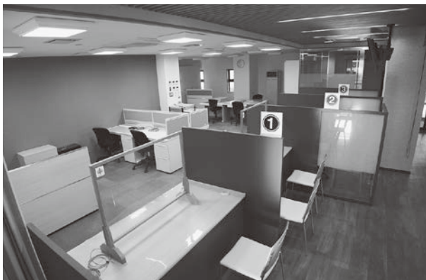
▲役場第二庁舎として生まれ変わった旧荘内銀行。 オープンセレモニーは年明け1月5日を予定。

産業課（商工観光係を除く）と農業委員会が、12月18日から役場第2庁舎（旧荘内銀行金山支店）へ移転し、これまでに比べて、町民の皆さまが立ち寄りやすく相談しやすい窓口環境となります。引き続き、迅速かつ丁寧な対応に努めてまいりますので、お気軽にご利用ください。