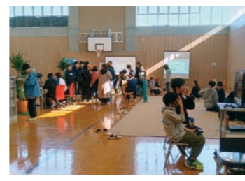
株メーカー主催 eスポーツ大会