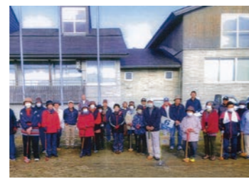
明安地区老人クラブ「桃ノ木クラブ」 グラウンドゴルフ大会