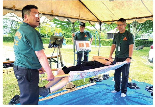
三枝地区の自主防災訓練