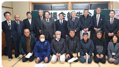
12/10 西郷地域 (朴山地区公民館)

回答 議員の定数と報酬については、まさに検討を進めている重要なテーマです。いただいたご意見も参考に、来年度中には一定の方向性を示せるよう、議論を深めてまいります。