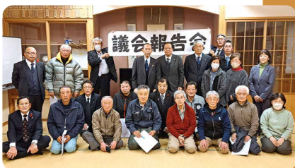
12/9 有屋地域 (宮地区公民館)