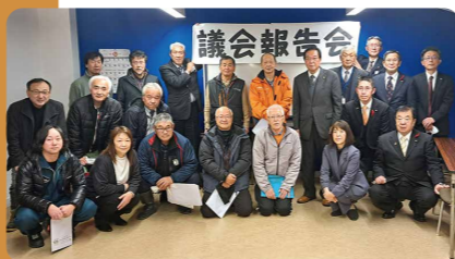
12/8 金山地域 (農村環境改善センター)

町民の意見を町政に反映させるため、12月8日から12日までの5日間、町内5会場で議会報告会を開催した。