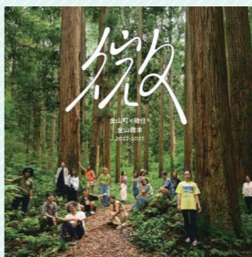
台湾向けガイドブック「金山微本」