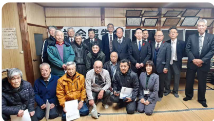
12/12 中田地域 (上中田地区公民館)