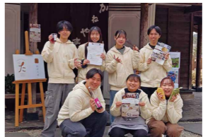
金山お土産づくりプロジェクトに取り組んだ皆さん

答 総務課長 金山の魅力を高める具体的な計画を作る。事業の目標は、交流人口・関係人口の拡大。広報と観光部門をまちづくり課として一つに集め、どのように展開できるかを検討する。