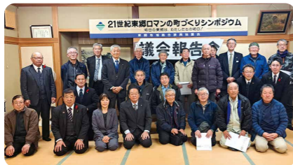
12/11 東郷地域 (ビーナッツ工房)