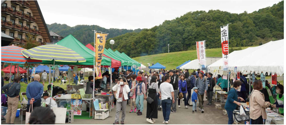
賑わいをみせる産業まつり