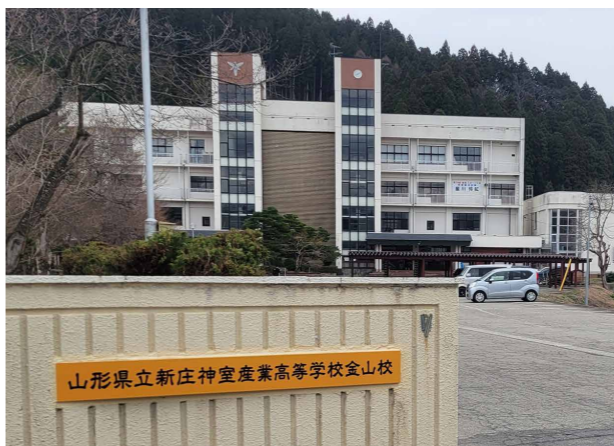
山形県立新庄神室産業高等学校金山校