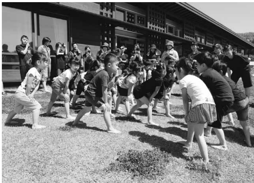
子どもたちの成長を後押し

6月議会定例会が6/3～7の5日間開催された。令和元年度一般会計、特別会計補正予算が審議され、一議案賛成多数、他は全員賛成で可決した。一般会計では、昭和56年七日町に建築した医師住宅付近の土地（大柳地内、149.71㎡）の購入費や5/14の落雷による旧認定こども園と金山中学校の電気修繕費などが計上された。町特別職の給与条例一部改正、町介護保険条例一部改正なども上程された。