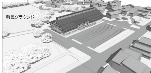
吹抜を除く床面積1,764㎡（雪止めあり）