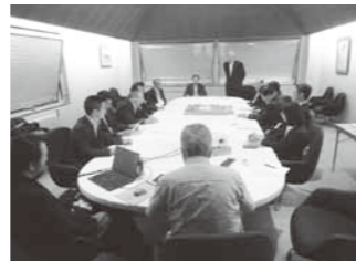
模型とスライドで説明を受ける