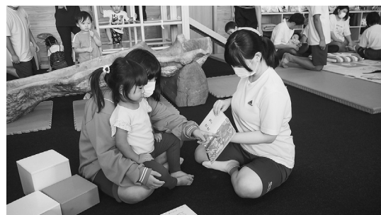
乳幼児と生徒のふれあい教室