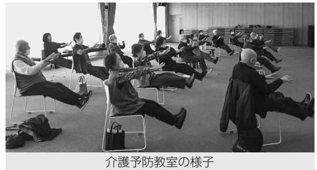
介護予防教室の様子

医療機関、介護サービス事業所、NPO組織、民生委員などと連携し、高齢者の皆さんがより暮らしやすい地域づくりを包括的・継続的にサポートします。その他に、介護予防事業や、介護者の相談会、一人暮らし・二人暮らし高齢者世帯等の生活状況把握と相談を行っています。