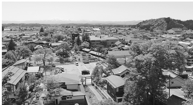
楯山(内町地区)から望む金山の街並み

また、金山の大工さんが手掛けた住宅を審査し、金山らしい住まいづくりを支援する住宅建築コンクールもリフォーム物件や住宅以外の事業所等の建築物も含めた表彰制度に改正していきながら金山杉を活かした家づくりを進めます。