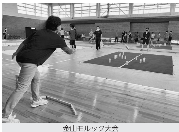
金山モルック大会