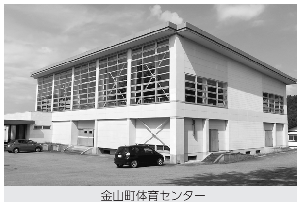
金山町体育センター

令和8年度は、体育センターのトイレ洋式化改修とバスケットボールリングの更新工事を実施します。