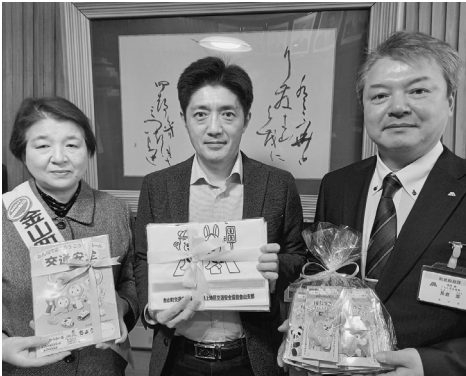
警察署や関係団体と協力し、小学校1年生へのランドセルカバの贈呈や事業所訪問など、交通事故や飲酒運転撲滅のための啓発を行っています。

交通安全専門指導員による交通安全指導、広報・巡回活動の強化や、関係団体と連携した飲酒運転撲滅等の啓発活動、高齢者へのサポカー補助金や免許返納への助成などにより交通事故防止に努めます。