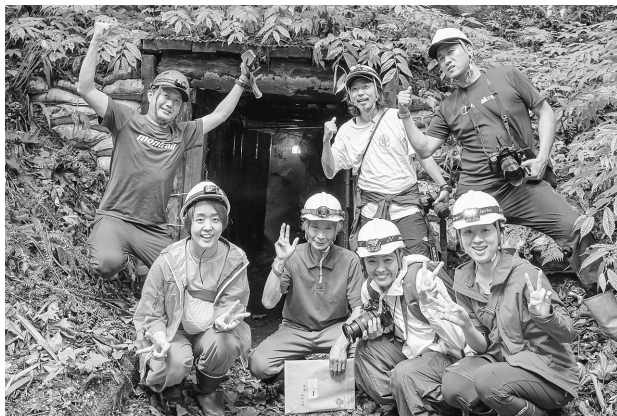
関係人口創出事業

さらに、観光協会の果たす役割も大きくなっており、関係機関との連携のもと、金山の魅力アップや金山まつり等の集客に向けた取り組みをはじめとする多くのイベントを実施し、PRや情報発信について拡充していきます。