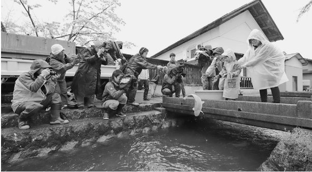
春の風物詩「大堰鯉の放流」

淡水魚の維持増殖と養殖業者支援のため、放流を行う団体への補助や稚魚の放流、町の景観・観光事業に重要な「大堰の鯉」の計画的な放流を行います。