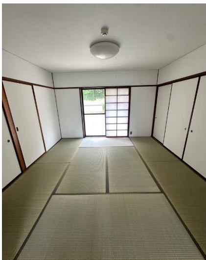
和室 8 畳