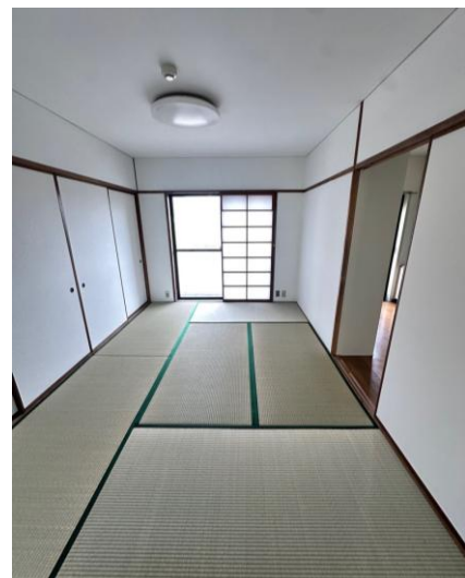
和室 6 畳