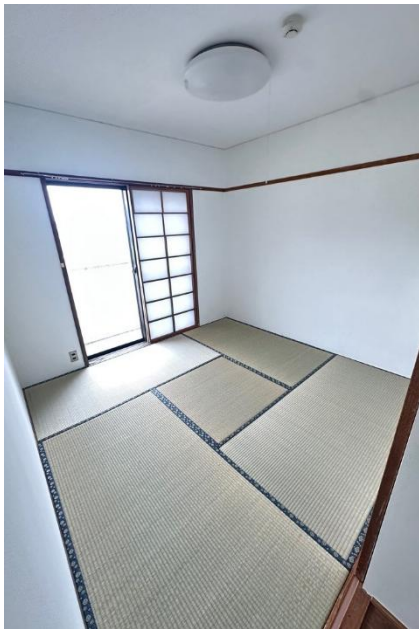
和室 4.5 畳