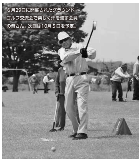
6月29日に開催されたグラウンド・ゴルフ交流会で楽しく汗を流す会員の皆さん。次回は10月5日を予定。

今年も、丹精込めて作り上げたきらびやかな山車が、お囃子とともに金山の街並みを練り歩きます。最終日に納涼花火大会がまつりのフィナーレ飾るほか、14日にはマルコの蔵前広場でビアガーデン「夜空市」、16日には「かねやま青空音楽祭」が開催され、金山の夏をさらに盛り上げます。