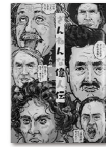
ざんねんな偉人伝 (真山知幸/学研プラス)

ふしぎなあおいふく (サトシン) / 「呼吸」「姿勢」「歩く」の新常識 (日経特別編集) / 手作り贈るほめられ和菓子 (宇佐美桂子) / 最高の家計 (岩崎淳子) / 続々ざんねんないきもの事典 (今泉忠明) / 羽州ぼろ鳶組 花菩薩 (今村翔吾) / 残念な歴史人物 (真山知幸) / 未来 (湊かなえ) / マンガでわかる「いつも誰かに振り回される」が一瞬で変わる方法 (大嶋信頼) / 看護師も涙した老人ホームの素敵話 (小島すがも)