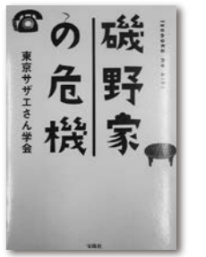
磯野家の危機 (東京サザエさん学会/宝島社)

歴史を変え、社会が大きく前進するような功績を残し、「偉人」と呼ばれる人たちがいます。でもそんな偉人たちには実は意外な一面が! やることに問題がありすぎるエジソン、イメージが違いすぎるリンカーン、とにかく極端すぎる夏目漱石、他にもたくさん。同じ著者の「ざんねんな歴史人物」もあります。