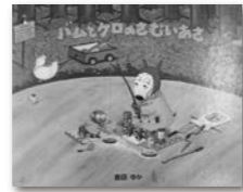
「パムとケロのさむいあさ」 島田ゆか/作・画 (文芸堂)

イヌとカエルって仲がいいのだからか悪いのだろうか。人間とイヌはご主人様とペットという関係。イヌとカエルはどんな関係なのだろうか。ちよつと意地悪そうないヌのパムは、ちよつとおつちよちよいのカエルのケロの世話をするのが、嫌ではなく意外好きかもしれない。そのお話の中に登場するおちやめなアヒルが夏の暑さを冬の寒さに変えてくれるかもしれない。猛暑を乗り越えるにはおすすめの絵本です!