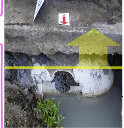
浄化槽が浮上して流入管が外れている