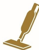
ハンディクリーナー