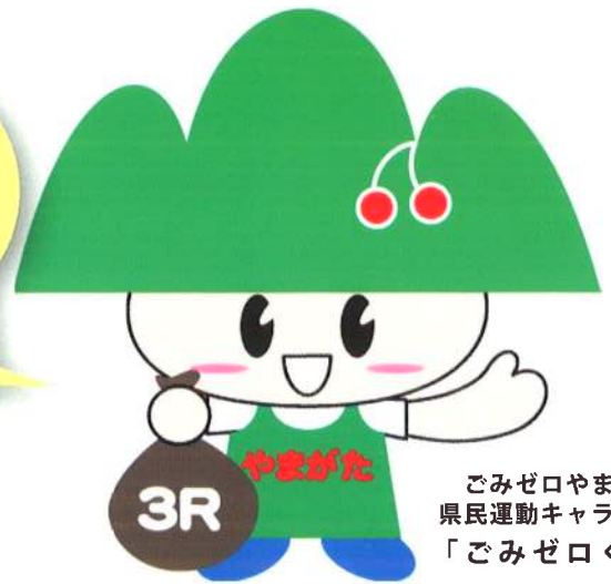
ごみゼロやまがた 県民運動キャラクター 「ごみゼロくん」

回収ボックスのあるスーパー、小中学校やごみステーションなどでリサイクルにご協力ください。