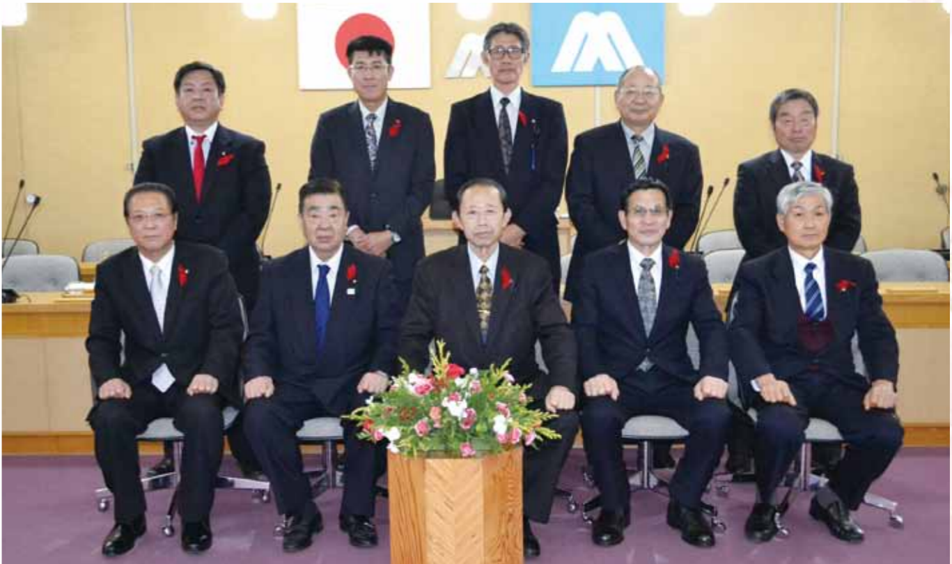
後列左より 高橋浩樹議員 中村忠行議員 沼澤道也議員 早坂憲明議員 高橋芳夫議員 前列左より 栗田保則議員 寒河江宏一副議長 柴田清正議長 矢口政一議員 須藤典夫議員