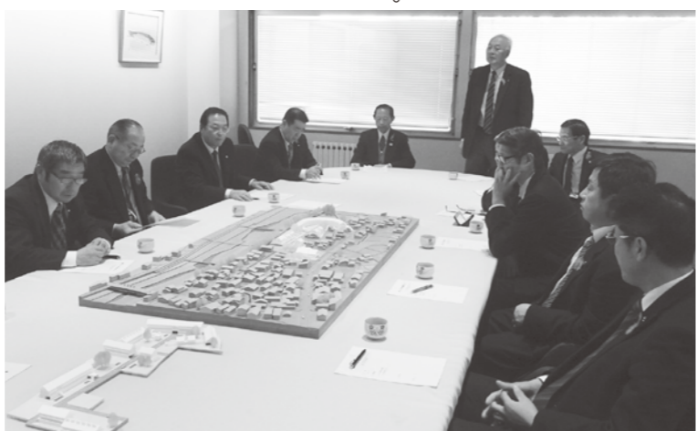
議会全員協議会にて（12/8）